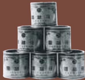
昭和10年、「クマイイ強精本舗」の人參強壯園が評判

1910年(明治43年)「作れお役に立つ身体」の理念の元、佐賀県有明町高町に溝上薬局を開局。1935年(昭和10年)白石町で製薬を創業。人參強壯園が評判になり全国に広がる。